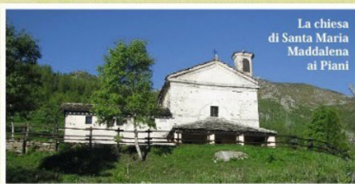
La chiesa di Santa Maria Maddalena ai Piani

Chi riuscirà a battere l'attuale record della gara avrà un ulteriore buono valore di € 150.