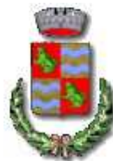
Comune S. Germano