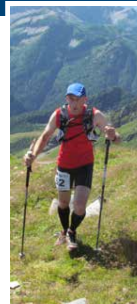
Obbligatorio K-WAY o maglia di ricambio a manica lunga PENA LA SQUALIFICA

Gara di Skyrunning + Mum & Kids in Valle Antigorio (VB) Piemonte